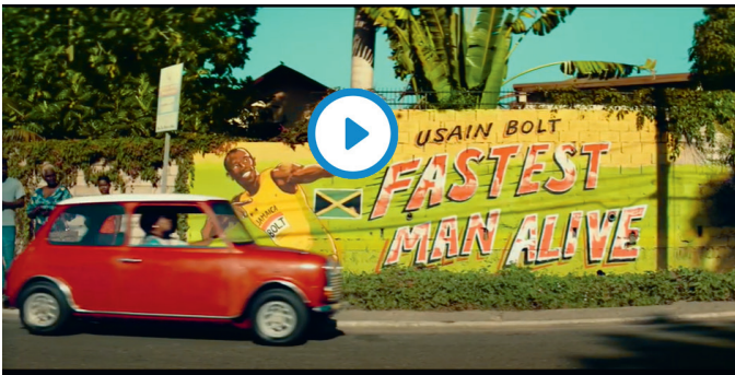
Commercial Allianz: Premieberekening binnen 20-sec met Usain Bolt

Zich beroepen op een autoriteit kan een standpunt ondersteunen. Soms is een autoriteit echter onbetrouwbaar, omdat diegene belangen bij de zaak heeft of omdat diegene geen autoriteit op het betreffende gebied is.